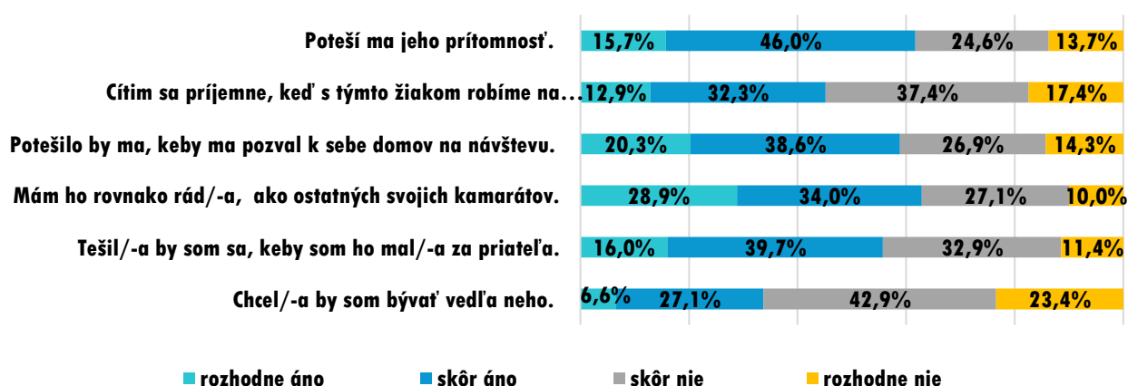
Graf 4 Reflektovanie emócií žiakov vo vzťahu k žiakom so ŠVVP

Z vyššie uvedených zistení vyplýva, že behaviorálne a emocionálne postoje žiakov k žiakom so ŠVVP boli u nezanedbateľného počtu žiakov neprijímajúce .