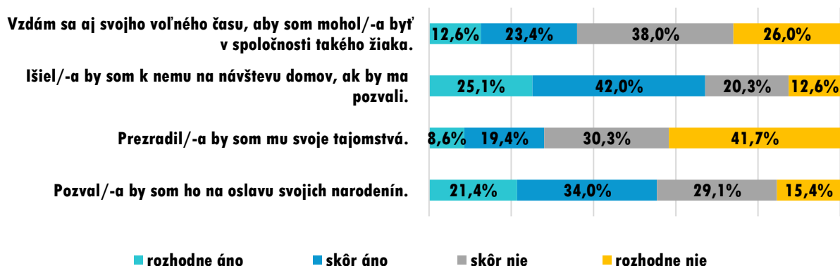
Graf 3 Postoje žiakov k žiakom so ŠVVP

Z dotazníka CATCH vyplynulo, že postoje žiakov k znevýhodneným žiakom boli do veľkej miery zdržanlivé. Kontakt s nimi by sa bránila veľká časť žiakov, o čom svedčí skutočnosť, že 32,9 % z nich by nešlo k nim na návštevu a až 44,5 % by ich nepozvalo na svoje narodeniny. Ešte väčšia časť žiakov odmietala dôvernejší kontakt s touto skupinou žiakov, pretože 64 % žiakov by nebolo ochotných tejto skupine žiakov venovať svoj voľný čas a až 72 % žiakov by sa im nezdôverilo so svojím tajomstvom.